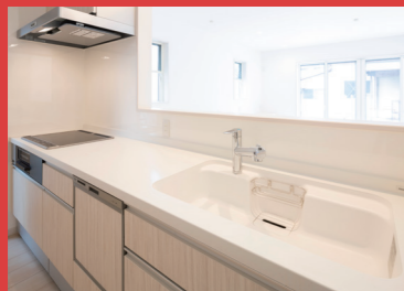
システムキッチン (食洗機・ディスポーザー含む)