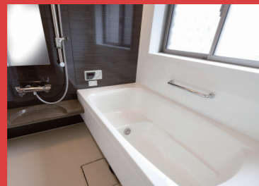
システムバス (24時間換気含む)