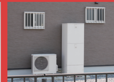
エコキュート給湯器