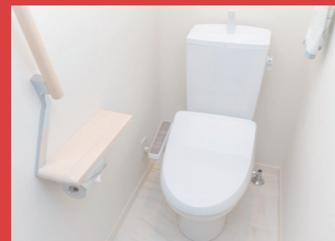
温水洗浄便座 温水洗浄一体型便器