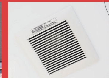
換気扇24時間換気システム